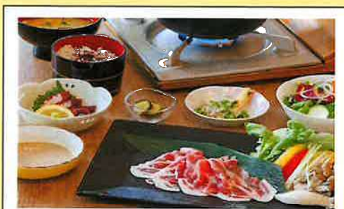
【シェフのおまかせメニュー】